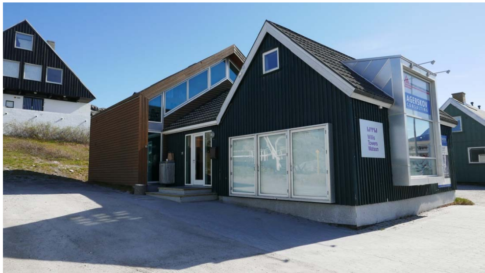
Fig 9: B-559 Ilasatut assersuutissaqqippoq qanga illuliaasimasumit immikkuullarissuugami, aammalu illulortaatsimut tunngatillugu piffissamut naleqquttuulluni.