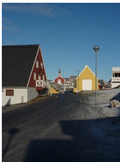
Fig 3: Nuutoqaq/ Kolonihavnen Annaassisitta Oqaluffiata tungaanut isikkivik

Illoqarfiup assinga Nuuk ilanngullugu kommunimut pilersaarummut tapiliussaq maannakut atuuttoq illunik eriaginartunik suliarinninnermut sakkugineqassaaq – kommunimi suliamik ingerlatsinermi aammalu illunik piginnittut ataasiakkaat illuutiminnik aserfallatsaaliineranni.