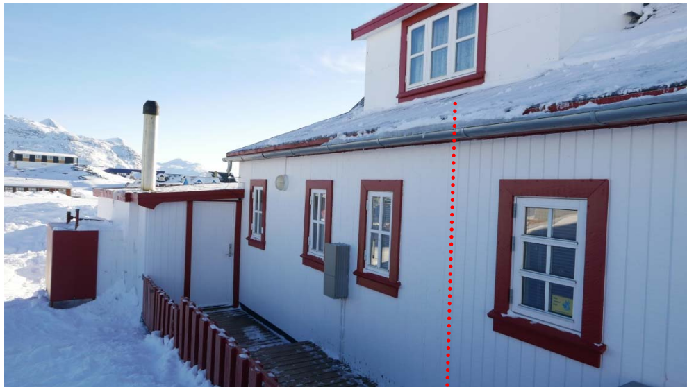
Fig 11: B-821 tallineqarsimavoq. Matumani ilassutaani sananeqaqqaarnera attatiinnarlugu, ersinngingajalluni, taamaallaallu qisuk qalliutaasoq allannguallaataalluni. Kisianni suli suna sananeqaqqaarnerani sunalu ilassutaanersoq takuneqarsinnaajuarpog.