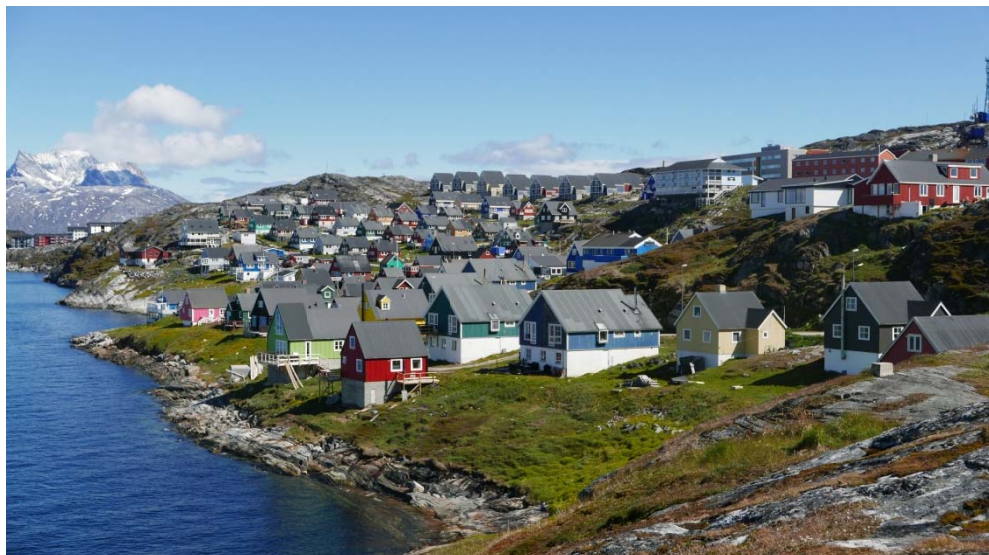
Fig 6: Immikkoortup 1A6-ip – ilisarnaatigaa illut mikisunnguit nuugissunik qaliillit tamaaniimmata