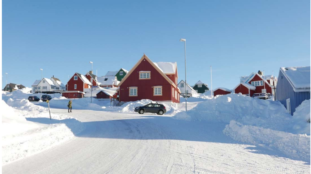
Fig 7: Immikkoortoq 1A7-ip – ilisarnaatigai nammineerluni illuliat tamaaniimmata

1A7 tassaavoq illoqarfimmi nammineerluni illuliorfigineqartut pisoqaanersaat, piffissalli ingerlanerani allannguuteqarsimavoq siullermik ilaqutariit ataatsit illui mikisuaqqat malunnarneroriarlutik, maannakkut anginerujussuarnik illuliorfigineqarluni amerlasuutigut takussaavallaartutut isikkoqarlutik, ilisarnaataanillu ingiaasimasutullusooq isikkoqalersitsilluni.