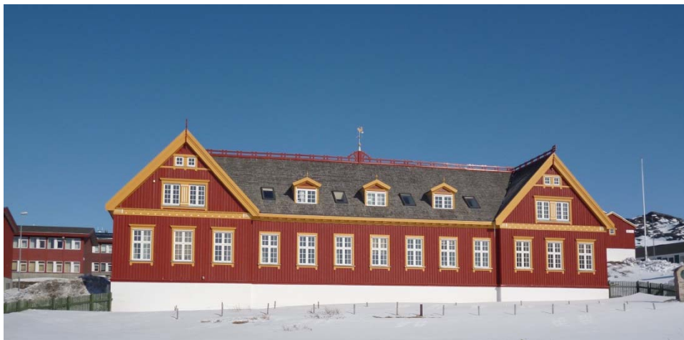
Fig. 8: B-144 fra 1906 beliggende i 1C15

1C15 er kendetegnet som et uddannelsesområde med både gymnasiet og seminariet. I dag er der en række tilknyttede bygninger i forskellige arkitektoniske stilarter. Miljøet omkring de meget fine seminariebygninger, særligt B-144 og B-148, skal dog beskyttes så de skalaen i området bevares.