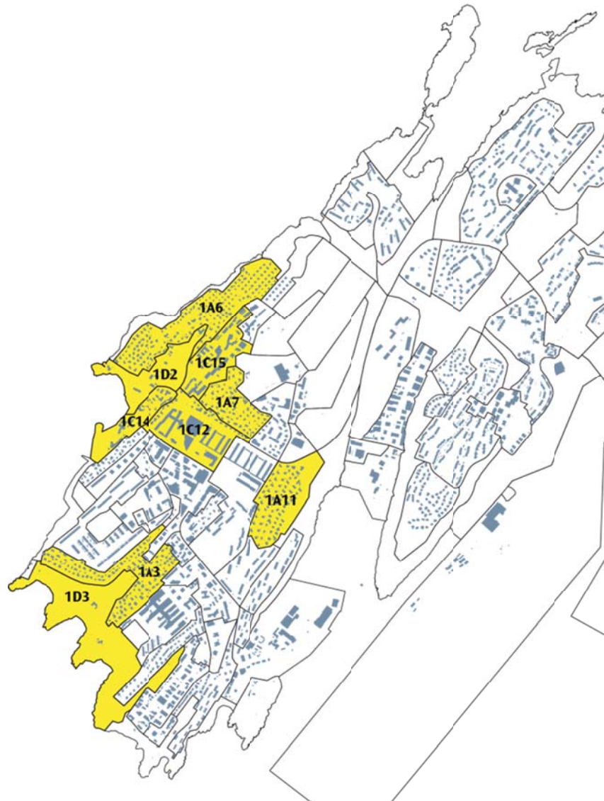
Fig. 1: Planområdet