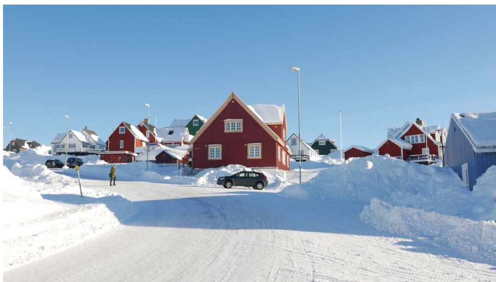
Fig. 7: Område 1A7 – kendetegnet af selvbyggerhuse

1A7 er et af byens ældre selvbyggerområder, der dog med tiden har ændret noget karakter fra at være meget små og beskedne enfamiliehuse, til nu at have betydeligt større huse, der på mange måder virker dominerende og i nogen grad har ødelagt karakteren.