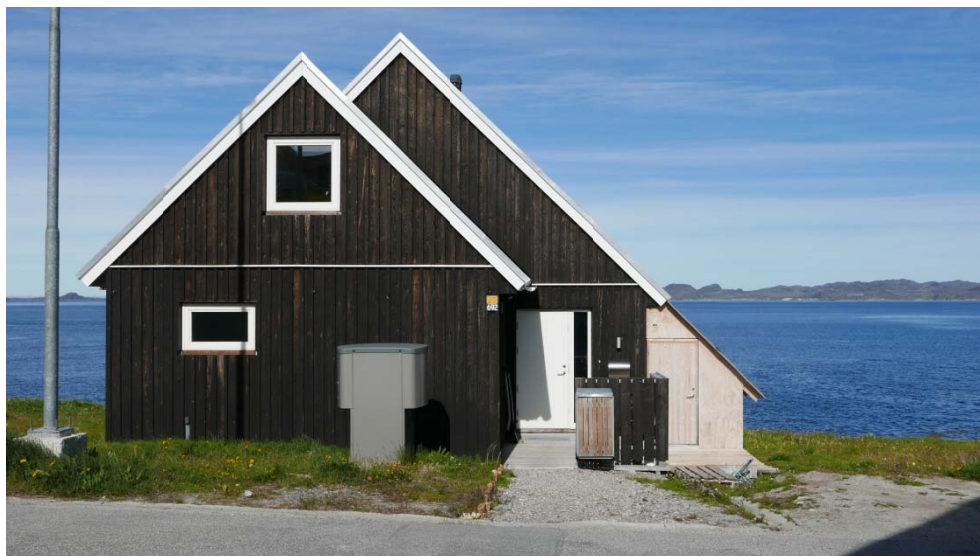
Fig. 10: B-692 Eksempel på en tilbygning, der med sin traditionelle udformning respekterer det oprindelige bygningsudtryk (type 16), men som dog tydeligt fremstår som tilbygning. Den er et eksempel et tidssvarende arkitektonisk udtryk.

En tilbygning kan også udformes som mere diskret og i forlængelse af den oprindelige bygningskrop, med eksempelvis et skifte i materialet (jf. fig. 11). Uanset hvilket arkitektonisk koncept der vælges, er det vigtigt at den oprindelige bevaringsværdige hovedbygning fremstår som netop hovedbygning. Det er altså denne bygningsdel, der er den primære volumen, og en tilbygning underlægger sig denne.