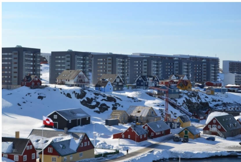
Fig. 2: Nuutoqaq/ Kolonihavnen og byens gamle bydel med Tuapannguit tårne bagved.