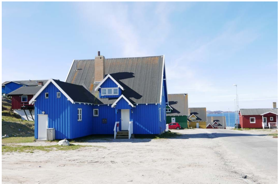
Fig. 5: 1A3 – Typehuse type 491