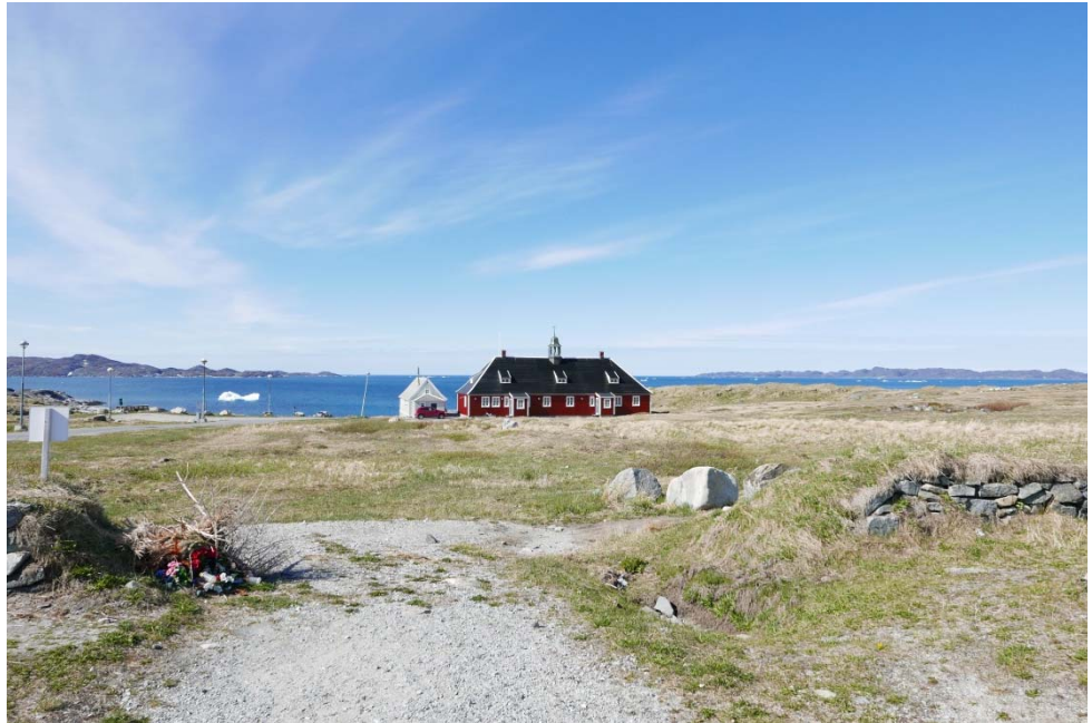
Fig. 4: B-7 fra 1747/ 48 beliggende i 1D3

For områderne 1C14 og 1D3 og delvis 1D2 gælder, at det er de allerførste bydannelser. Her finder vi de første bebyggelser, og særligt 1C14 også vej og bebyggelsesstrukturer.