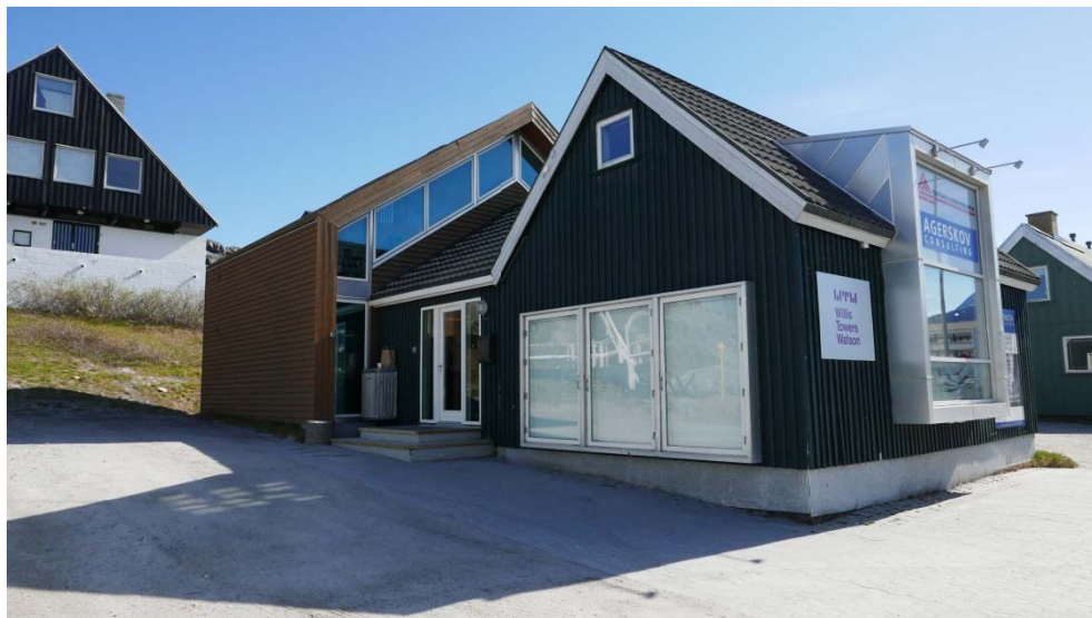
Fig. 9: B-559 Eksempel på en tilbygning der tydeligt adskiller sig fra den oprindelige bygning, og som i sit arkitektoniske udtryk er et tidssvarende bud.