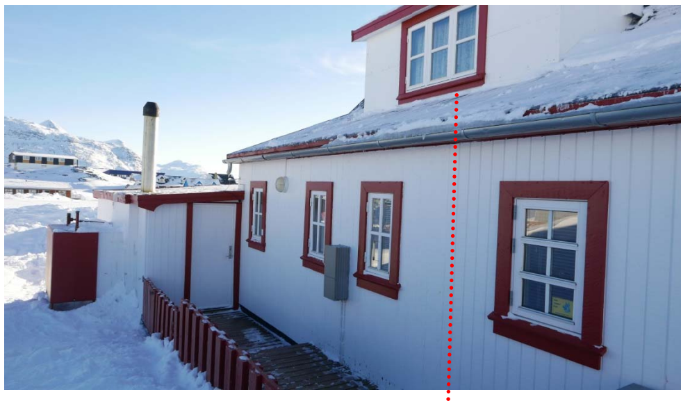
Fig. 11: B-821 der er forlænget. Her er tilbygningen holdt indenfor den oprindelige bygningsvolumen og fremstår meget diskret, kun med et skifte i typen af træbeklædning. Man kan dog stadig aflæse hvad der er oprindeligt og hvad der er tilbygget.